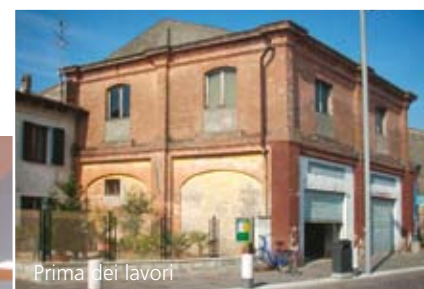
Prima dei lavori

mente restaurato sui due piani e le sue ampie vetrate si aprono ora su una saletta dedicata a spazio mostre e bancone accoglienza; al primo piano, un'ampia sala conferenze dona invece una suggestiva vista sugli edifici del borgo. Il punto informativo offre un qualificato servizio non solo ai turisti ma anche ai numerosissimi camperisti che sostano nell'area attrezzata per camper realizzata a Grazie.