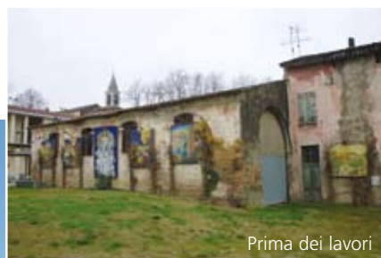
Prima dei lavori

azione di nuovi spazi in grado di ospitare con modalità integrate un bici-point,, un ricovero canoe, una sala polivalente e una cucina con sala degustazioni, in un luogo rinnovato per le sue importanti tradizioni eno-gastronomiche.