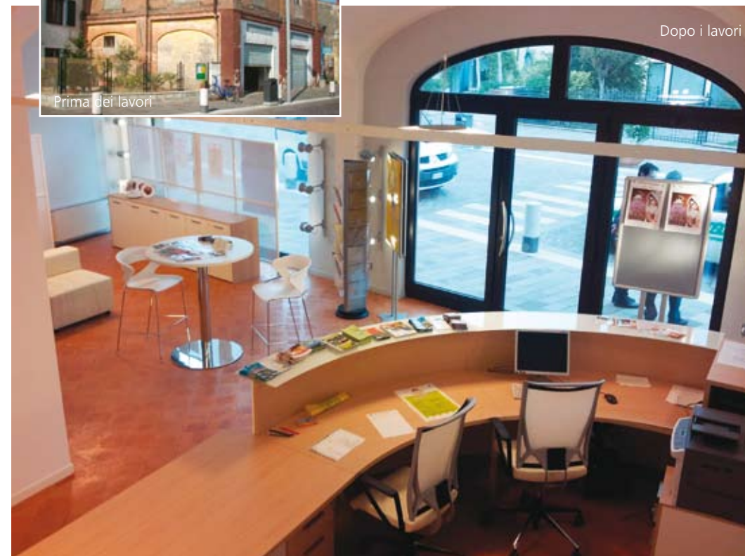
Dopo i lavori