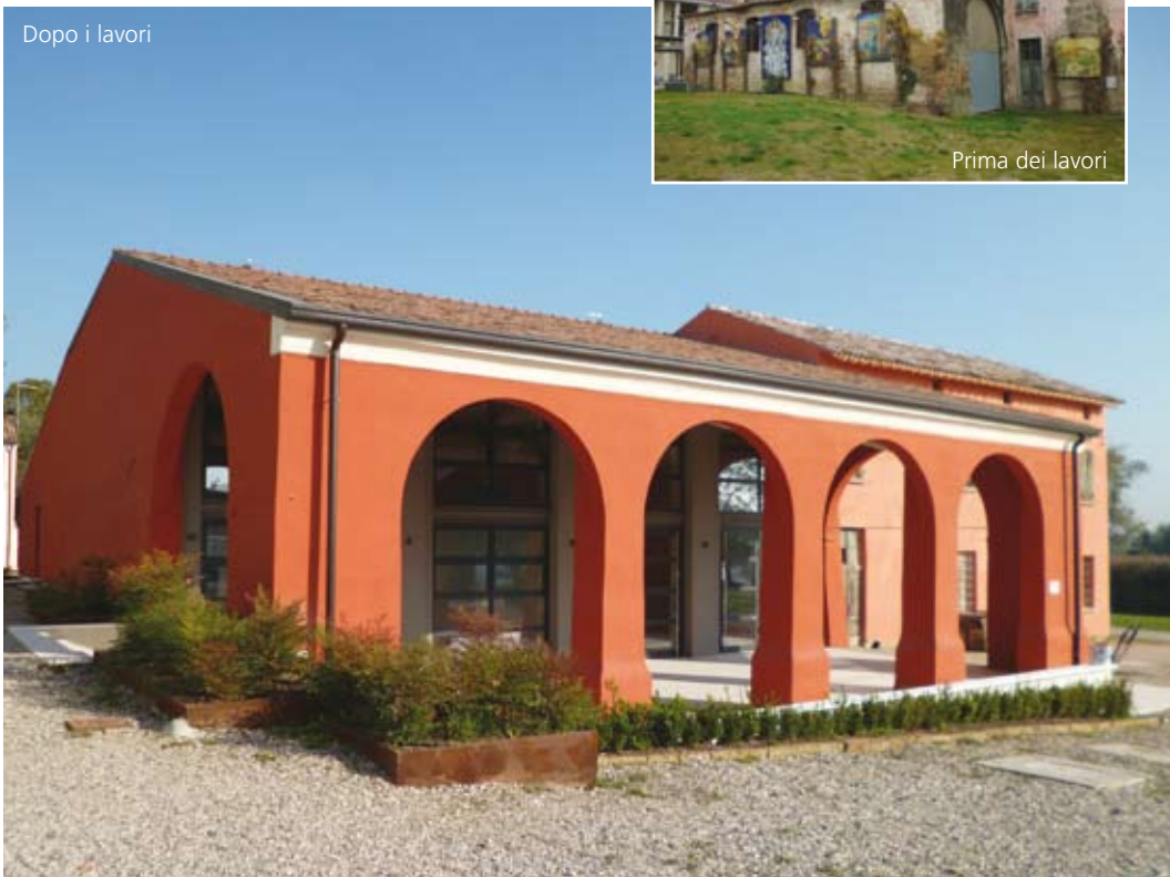
Dopo i lavori