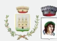
Comune di Borgo Virgilio